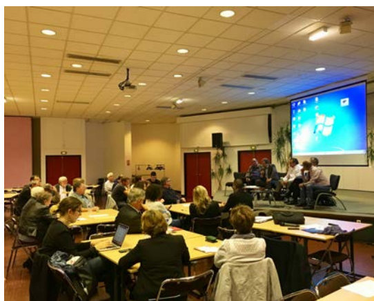
RÉUNION PUBLIQUE DU 21 SEPTEMBRE À LA MAISON DES SYNDICATS DE CRÉTEIL.

Le CICE ? Kézako ? Le Crédit d'Impôt Compétitivité Emploi (CICE) a été mis en place en janvier 2013, pour « améliorer la compétitivité et l'emploi des TPE-PME exposées à la concurrence internationale ».