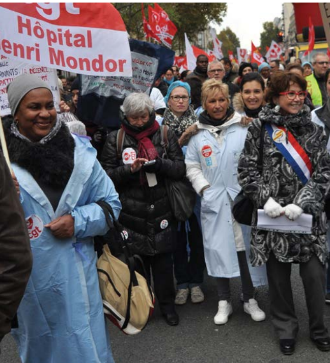
MANIFESTATION DES PERSONNELS DE SANTÉ, LE 8 NOVEMBRE 2016 À PARIS.

En 2015, 216 000 femmes ont été victimes de violences physiques ou sexuelles, et 118 ont été tuées