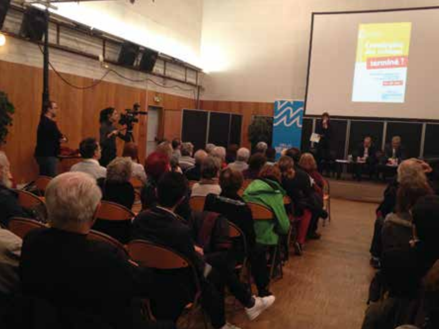
Rencontre publique d'information sur la bataille de défense des politiques départementales, organisée Salle Le Royal, mardi 14 novembre 2017, avec Christian Favier, Président du Conseil Départemental du Val-de-Marne.